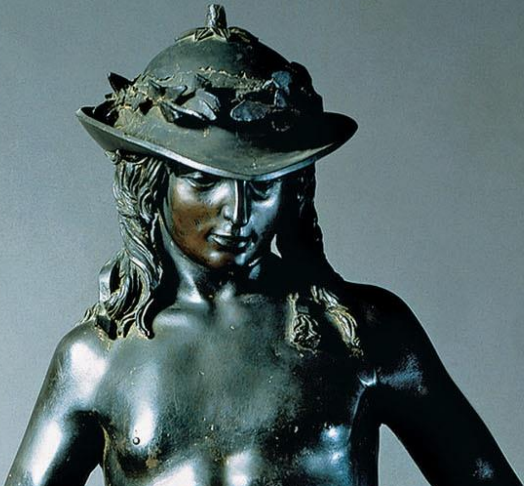
Donatello, David , bronze, détail, vers 1435-1440, Florence, Museo Nazionale del Bargello