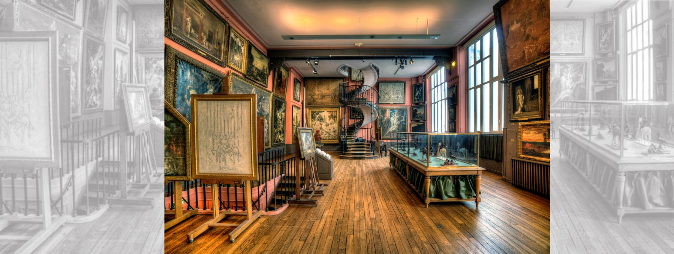
Musée Gustave Moreau, Paris