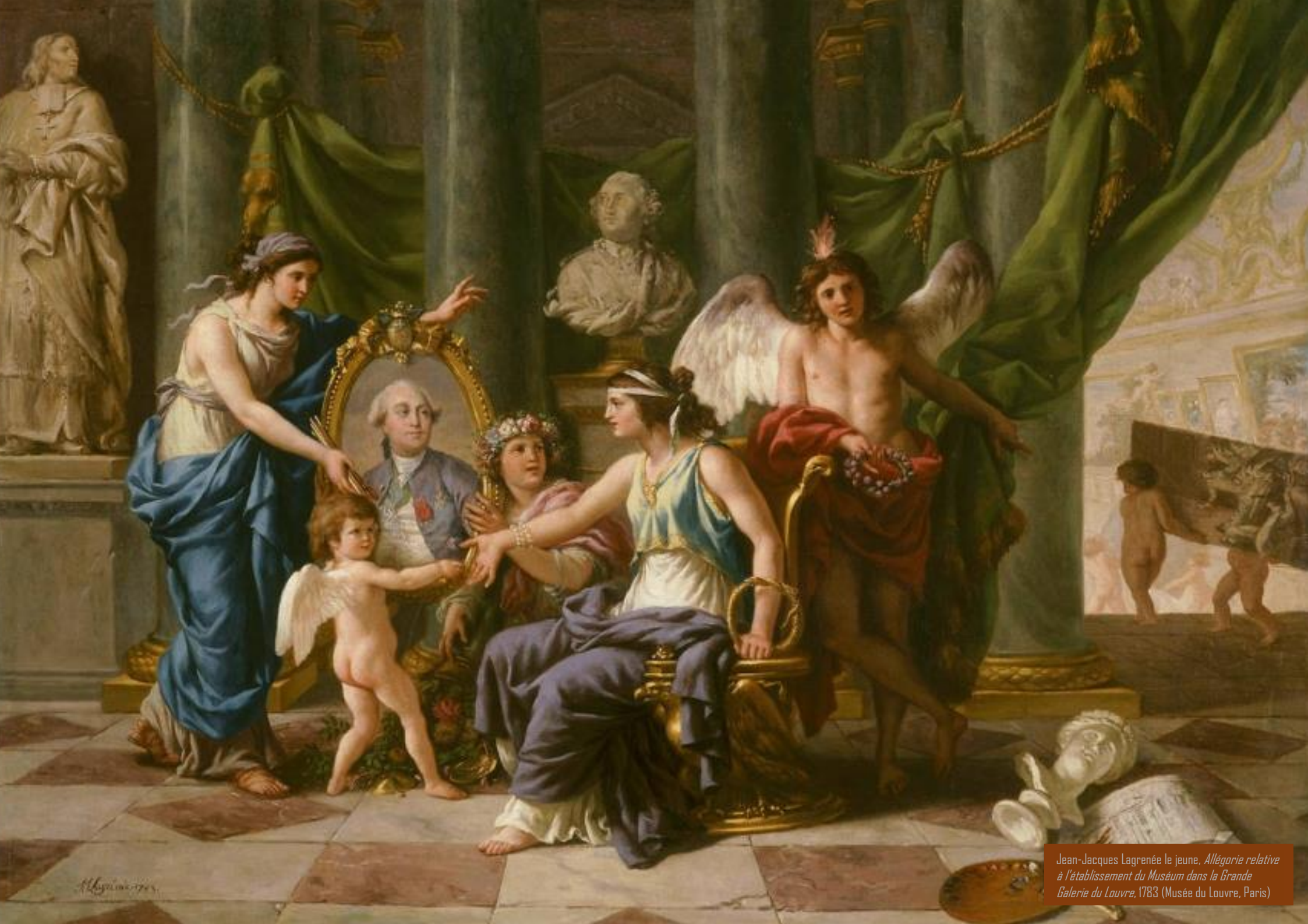
Jean-Jacques Lagrenée le jeune, Allégorie relative à l'établissement du Muséum dans la Grande Galerie du Louvre , 1783 (Musée du Louvre, Paris)