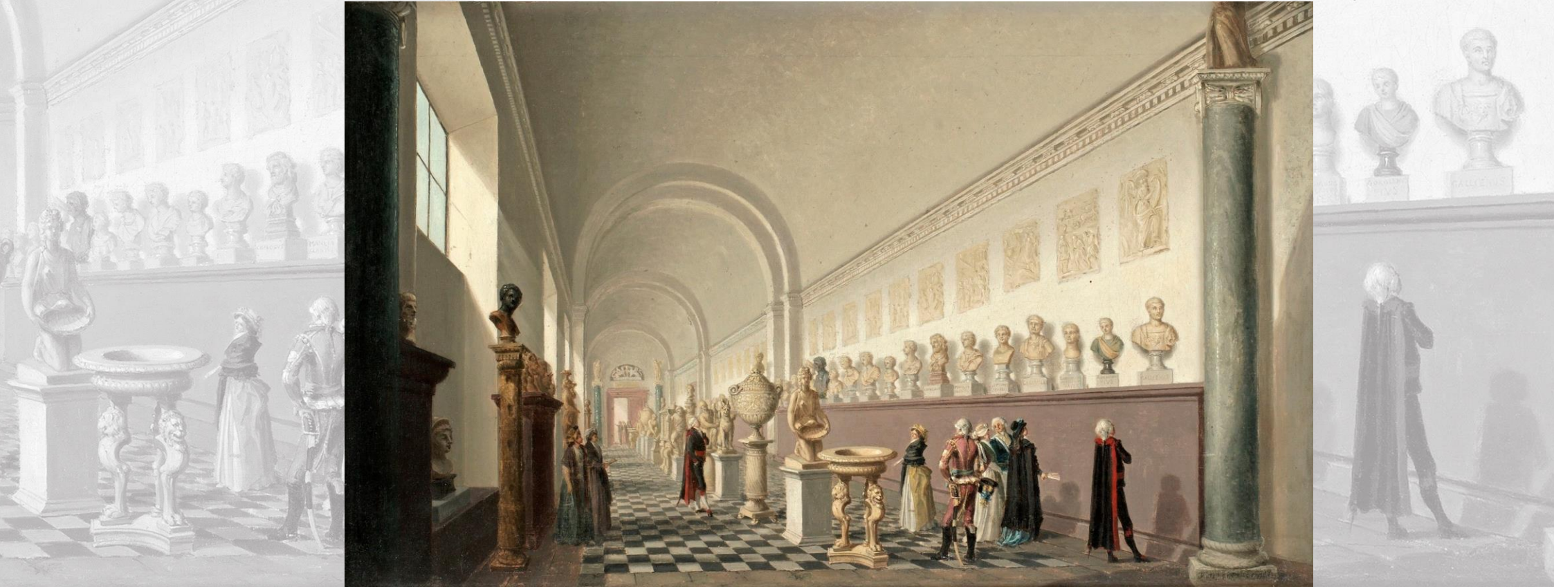
Pehr Hilleström, Musée du Palais royal, Stockholm, 1797 , huile sur toile, 47 x 77 cm.