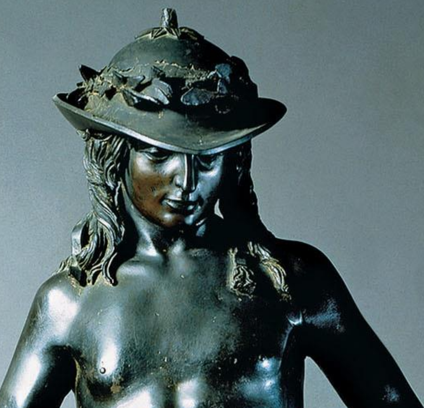
Donatello, David , bronze, détail, vers 1435-1440, Florence, Museo Nazionale del Bargello