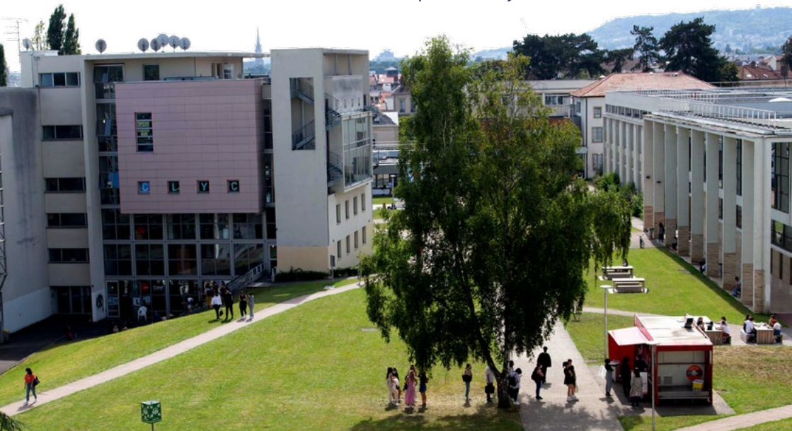
Campus de Nancy