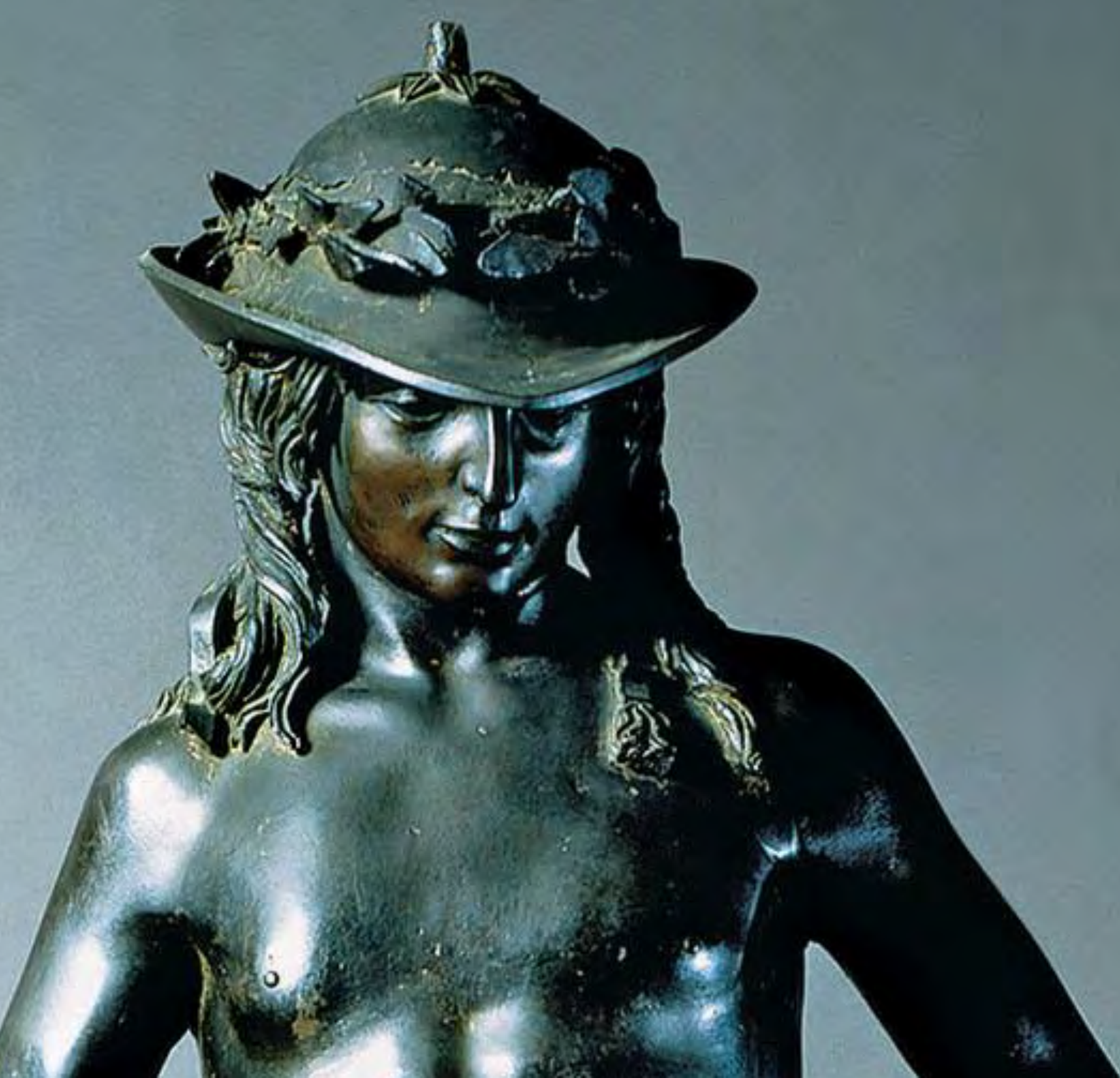
Donatello, David , bronze, détail, vers 1435-1440, Florence, Museo Nazionale del Bargello