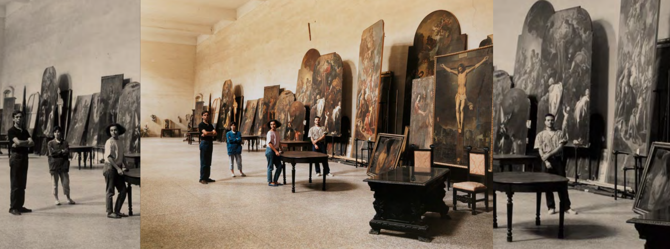
Thomas Struth, Restaurateurs à San Lorenzo Maggiore, Naples , 1988, tirage chromogénique, 119,1 x 159,7 cm