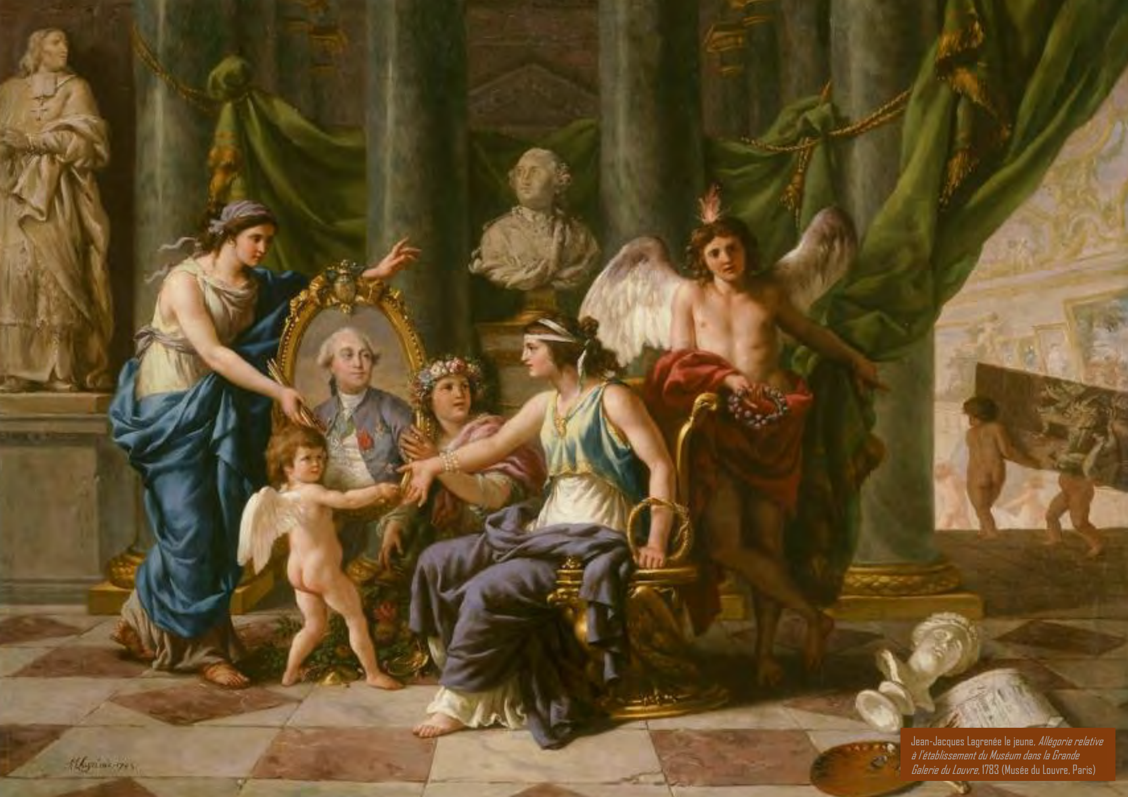
Jean-Jacques Lagrenée le jeune, Allégorie relative à l'établissement du Muséum dans la Grande Galerie du Louvre , 1783 (Musée du Louvre, Paris)