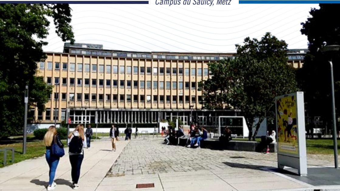
Campus du Saulcy, Metz